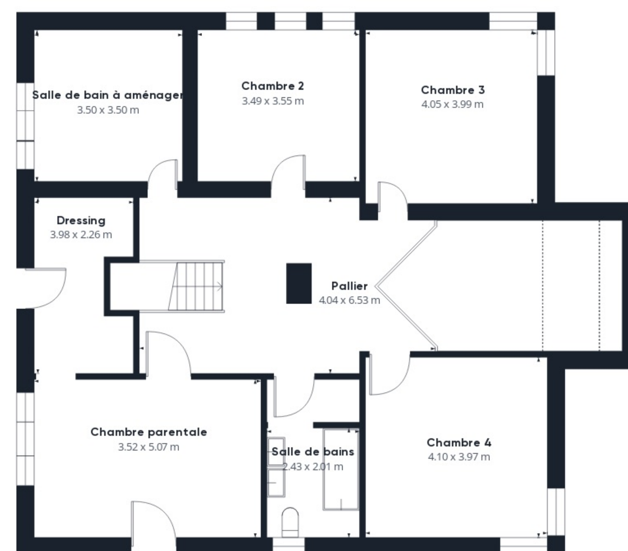
Niveau 1 Bâtiment 1