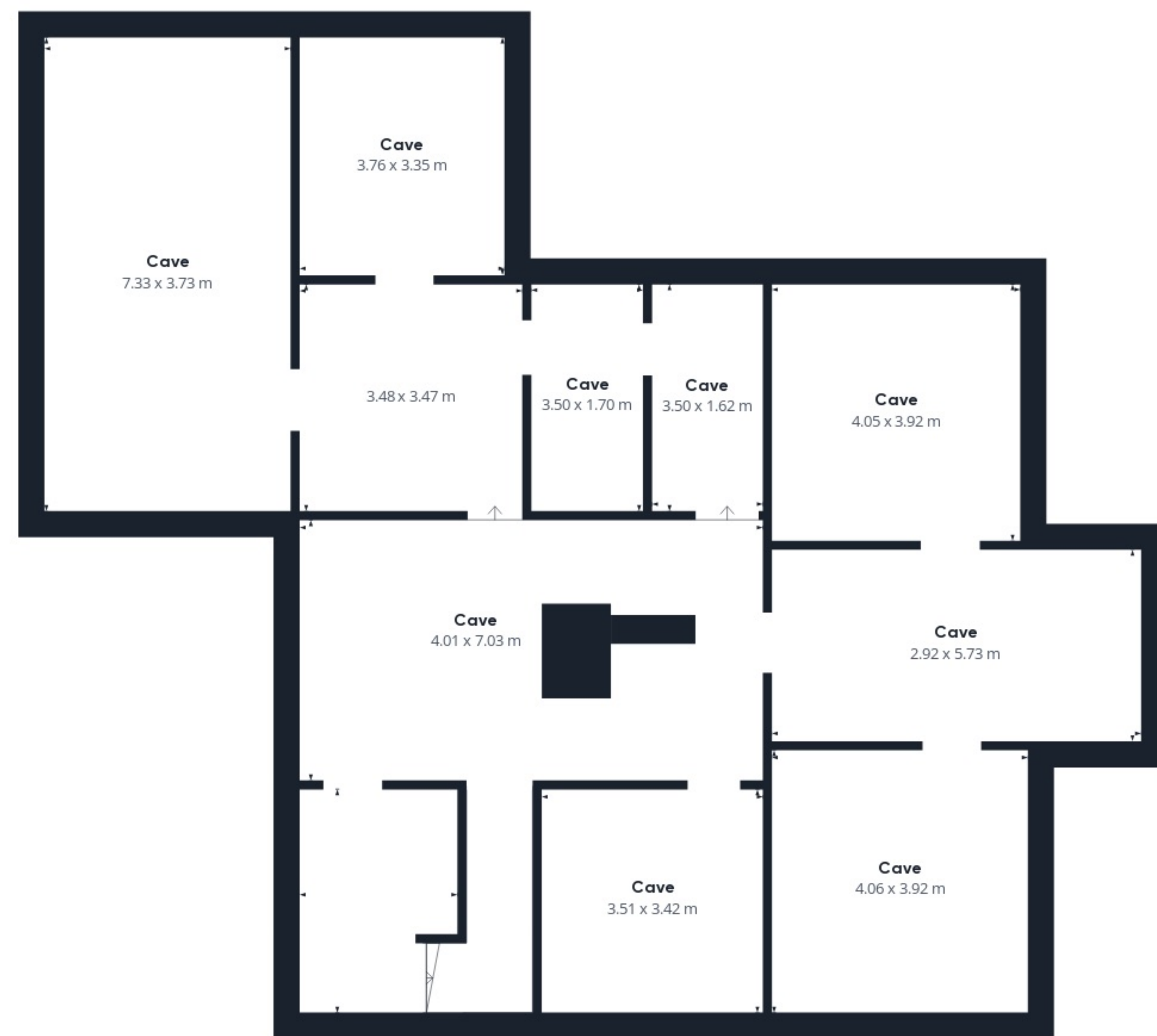
Niveau -1 Bâtiment 1