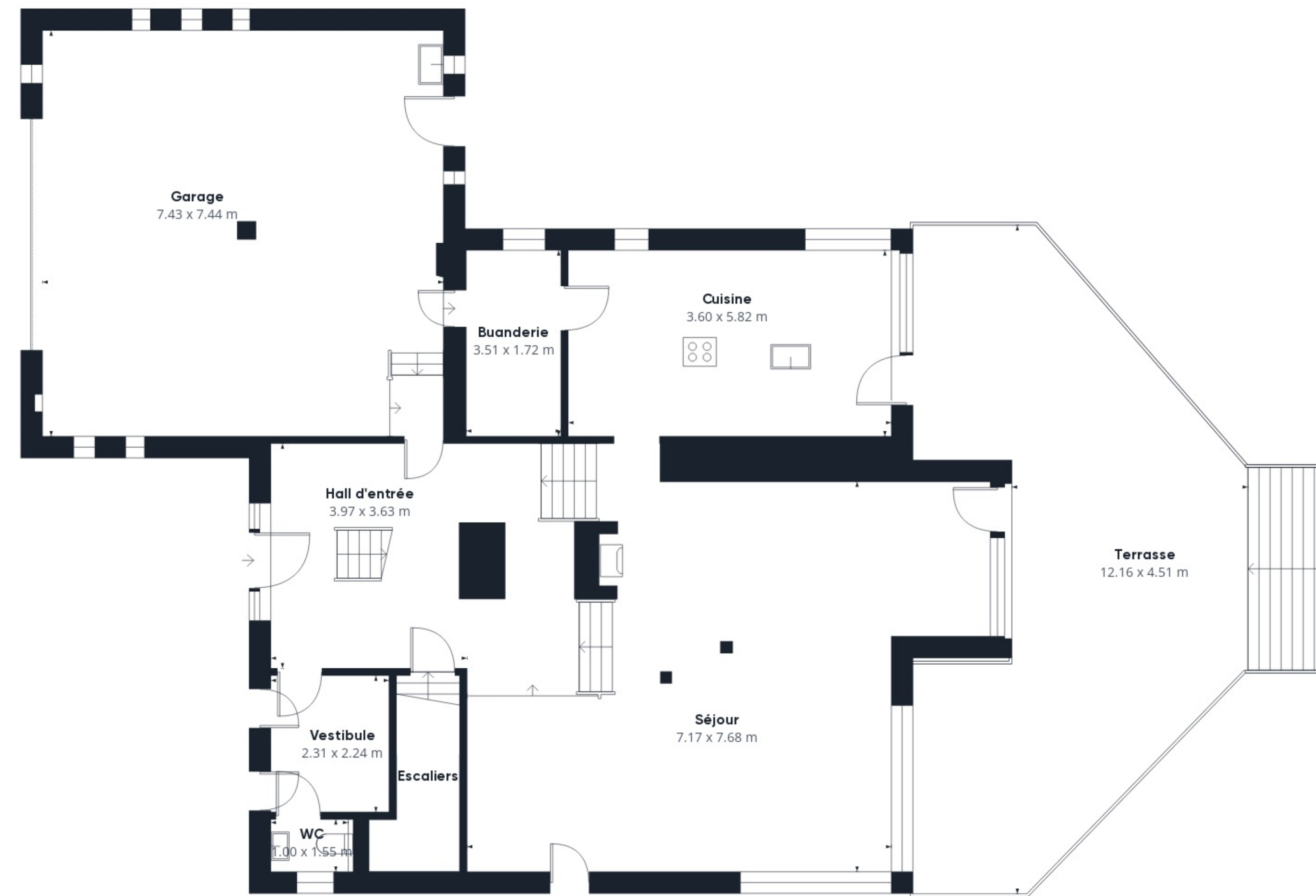
Niveau 0 Bâtiment 1